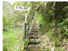
清掃前(上)と 清掃後(下)