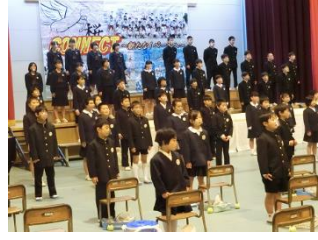
☆全校合唱 81名、迫力の歌声！ Believe を歌いました。