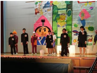
☆中期ブロック 色々と考えさせられる劇 でした。