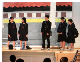
☆後期ブロック 自然な演技で、観ている 人を惹きつけました。