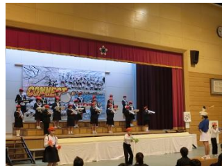
☆鼓笛隊 (4～6年生) 校歌&パブリカ 素敵な演奏でした！

今年は、感染予防の観点から、バザーの中止や来場者数の制限などがありました。パフォーマンスライブが復活し、去年とはまた違った盛り上がりを見せ、新たな1ページを刻むことができました。