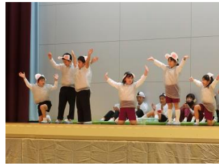
☆前期ブロック かわいさ満点！一生懸命さが伝わりました！