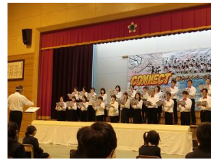
☆保護者合唱 美しいハーモニーでした。 感動的でした。