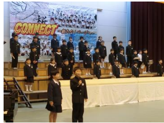
☆合唱・合奏(1～3年生) 元気をもらいました！ 司会も上手でしたよ！