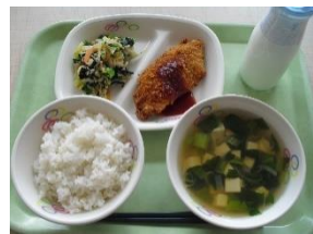
1月25日(水) ・魚のフライ ・磯香和え 【お魚給食】