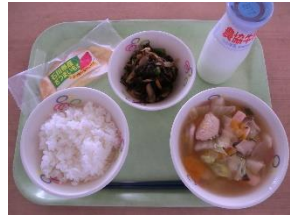
1月24日(火) ・かじめの五目煮 ・いしるの香り鍋風 【珠洲メニュー】