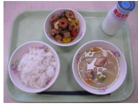
1月27日(金) ・石狩汁 ・鶏肉・ナッツ炒め 【北海道メニュー】