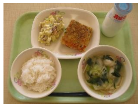
1月26日(木) ・おさつサラダ ・鶏肉の松風焼き 【さつまいも給食】