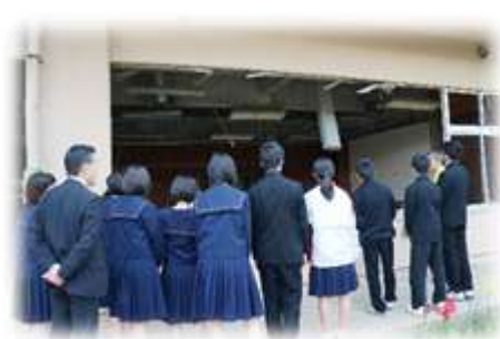
～旧中浜小学校前で説明を聴く生徒達～

9年生11名は、修学旅行（2泊3日）で東北～東京を訪れました。東日本大震災の大変な被害については知っていても、現地の被災状況を目と耳にした時は愕然としました。旧中浜小学校前では津波の酷さに圧倒されました。中学生5名が亡くなった山下中学校では、説明と実際の映像が重なり、本校生徒の涙がぽろぽろ止まりませんでした。