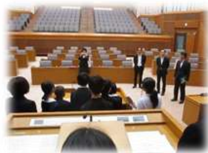
～議場で、児童と平蔵議員～

そのほか、北陸中日新聞社や兼六園周辺を見学。新幹線開通以来、人気が高まっている県都・金沢を2日間、満喫することができました。