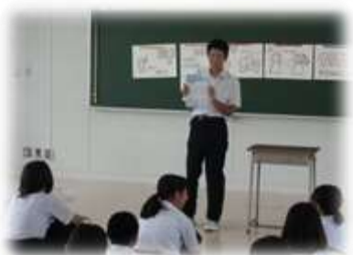
後期ブロック（行動宣言）