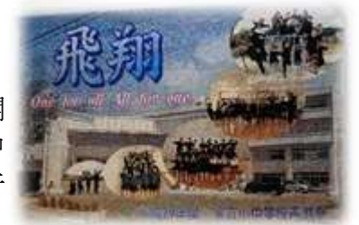
「モザイク画」5～9年生で作成

11月11日（土）、前身の宝立中学校で文化祭が開催されてから60回目の節目となる今年度から、小中一貫校の特色を生かした文化祭として、1日開催（音楽祭、表現祭の2部制）にしました。初めての試みは、不安もありましたが、全児童生徒がそれぞれに輝くことができた青潮祭となりました。来賓の方々をはじめ地域の皆様、そして保護者の皆様の積極的な参加・ご協力に、感謝申し上げます。