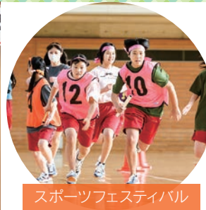
スポーツフェスティバル