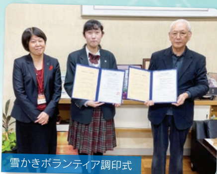
雪かきボランティア調印式