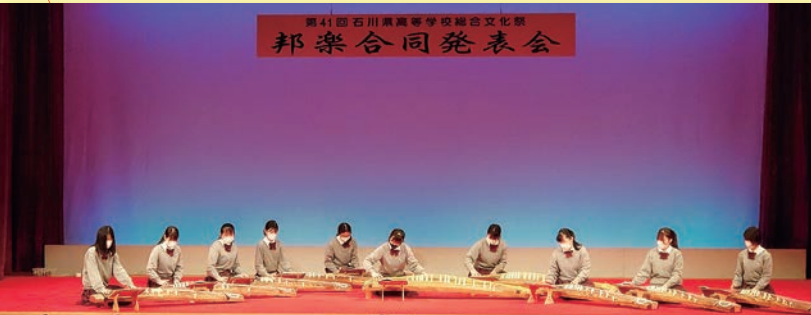
第41回石川県高等学校総合文化祭 邦楽合同発表会