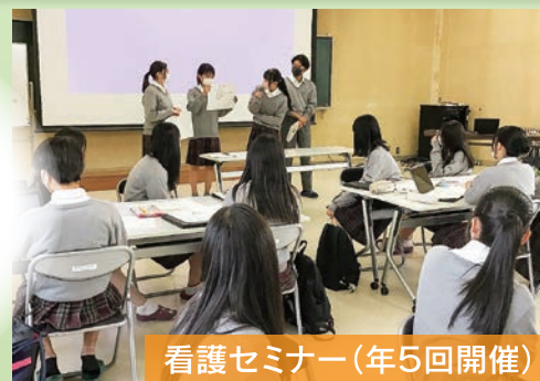
看護セミナー(年5回開催)

金沢伏見高校でしか できない体験型学習を通して 進路実現・夢実現に必要な 力を確実につけることが できます。