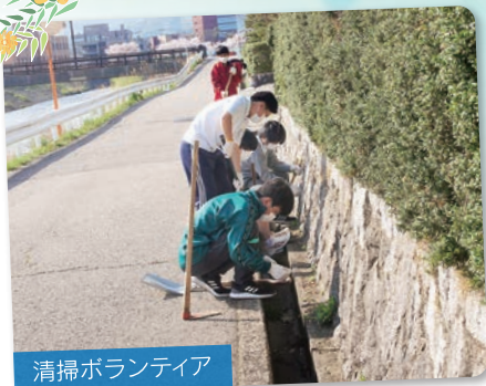
清掃ボランティア