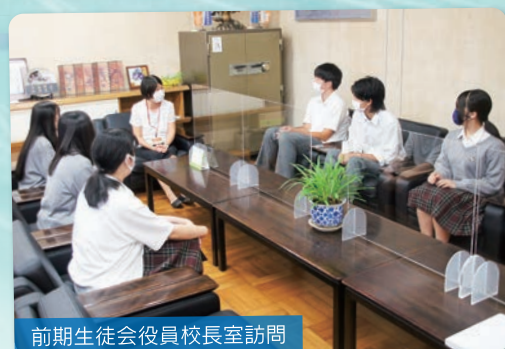
前期生徒会役員校長室訪問