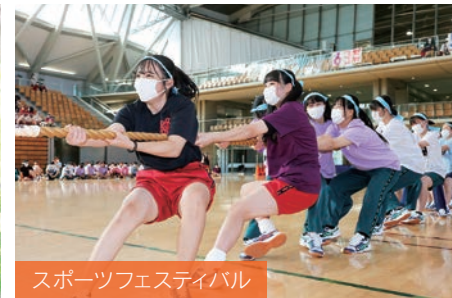
スポーツフェスティバル