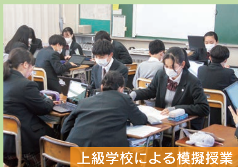
上級学校による模擬授業