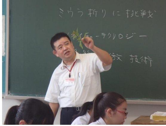
⑤ミウラ折りに挑戦 ～ぱっと広げられる生物のからだの畳み方～