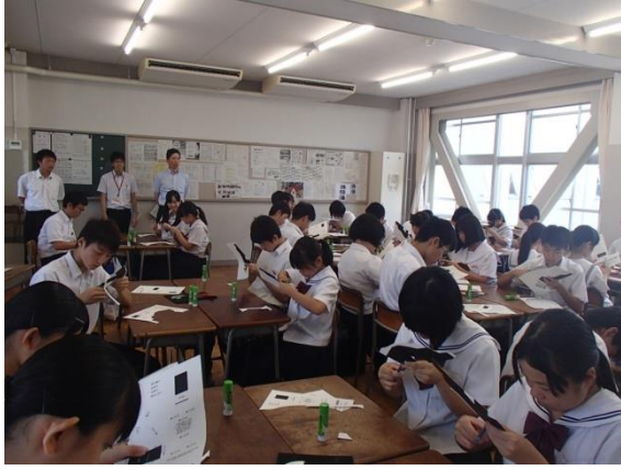
④分光器をつくろう ～スペクトラムの観察～