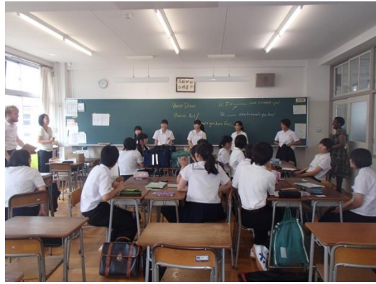
⑦Quiz in English ～ALTの先生と楽しく～