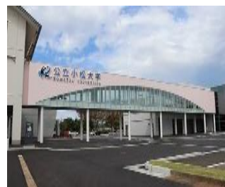
末広キャンパス (向本折町)