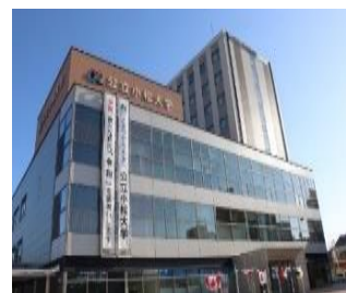
中央キャンパス (土居原町)