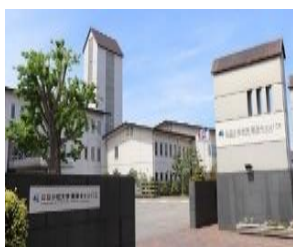
粟津キャンパス (四丁町)