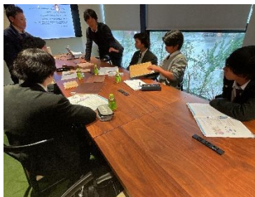
フルタニランバー株式会社