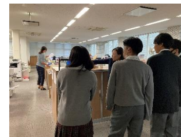
株式会社アーバンホーム