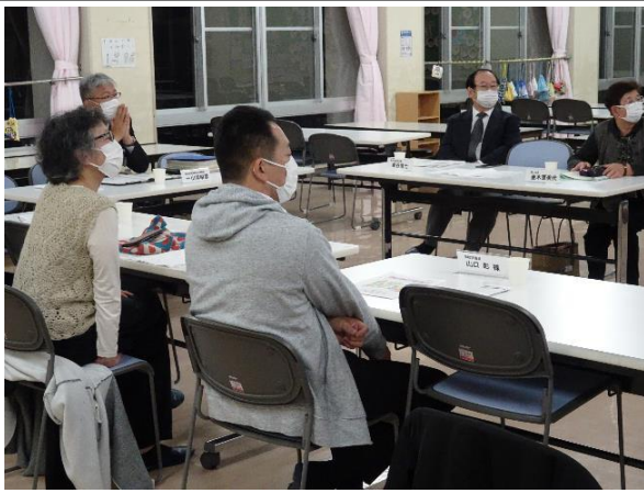
第1回学校運営協議会準備委員会の様子