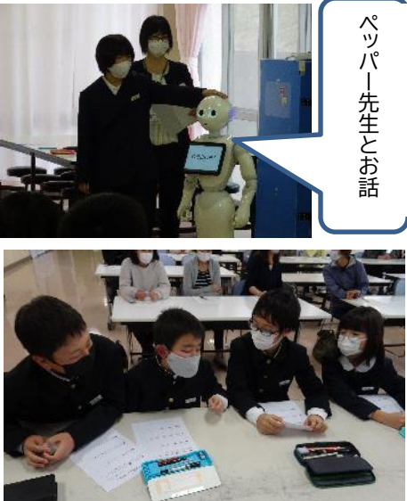
パッパー先生とお話

情報化社会がますます進んでいく中、ネットトラブルから子どもたちを守るために「使わせない」ではなく「モラルや約束を守って使う」方向へと、学校と家庭が連携して取り組んでいかななくてはなら