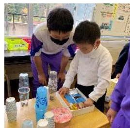
1年生の秋のお楽しみ会に高学年も参加