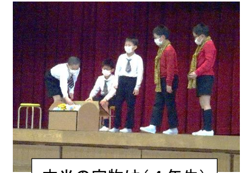
本当の宝物は(4年生)