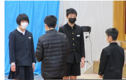
プレゼントわたし