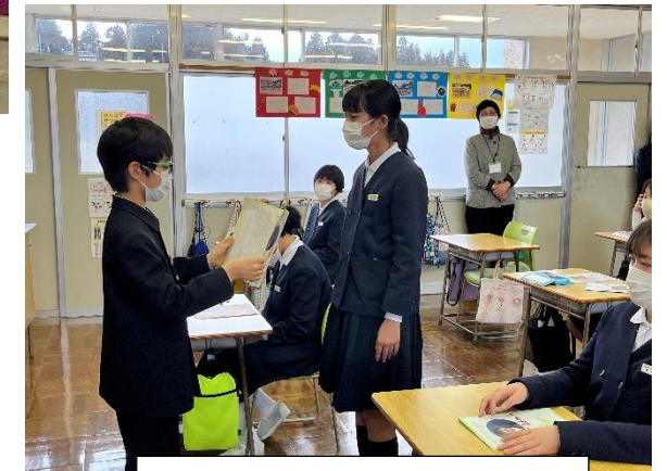
5年生からのメッセージ

みんなでげきがやれてたのしかったです。すこしきんちょうしたけど、がんばりました。2年せいになってもがんばります。