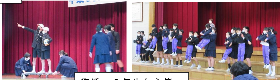
復活～6年生から皆へ