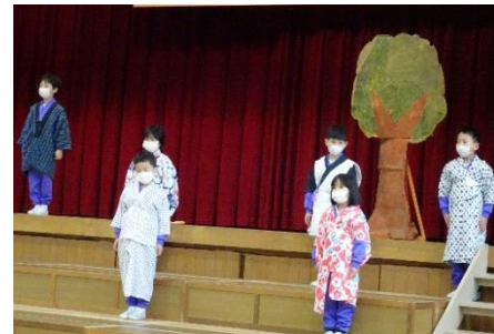
わらしべ長者(1年生)