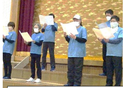
合唱「カイト」(保護者)