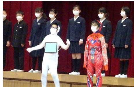
ペッパーからの試練 「6年生とは何か」(5年生)