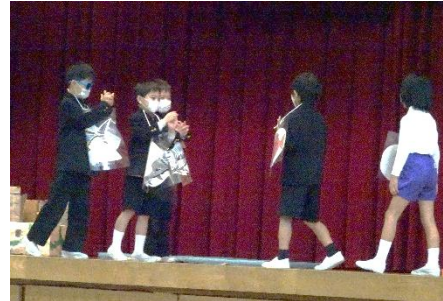
進撃のマグロ(2年生)