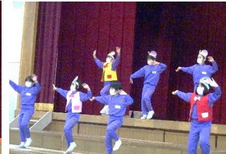
3年生のおとや(3年生)