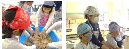
味噌作り 一月二五日(月) 三年生

今年も校歌伴奏引継ぎ式が行われました。全校朝会で歌う校歌の伴奏は、代々子どもたちが担当しています。これまで6年生が担当していましたが、いよいよ5年生に引継がれました。6年生が、自分の思いを語り、5年生に対してエールを送ってくれました。また、5年生全員が校歌伴奏を希望し、今後の意気込みを全校児童の前で伝えてくれました。毎年行っている引継ぎ式。子どもたちの言葉が、とても誠実で実感がこもっていました。