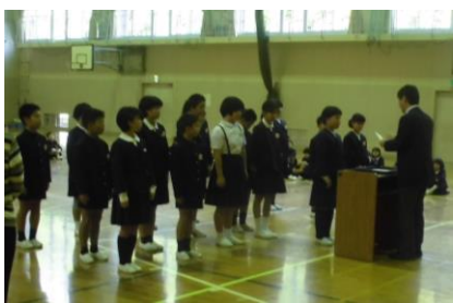
後期児童会の役員任命式です。これからも飯田小を良くしてください。

通機関を利用し、友だちも同様だということでした。一昨年、出張で金沢を通った際、十一月の冷たい雨風の中、たくさんの合羽姿の中学生自転車通学風景に出会いました。珠洲ではもう絶滅してしまつた姿ですね。 また、市内で勤務する内灘出身のある若手女性職員は、「わたしは家から西高(金沢西高校)まで、毎日自転車通いましたよ。親は送ってなんかくれませんでした」などと言っています。そう考えると、珠洲の子どもは過保護なのかもしれません。 とはいえ、学校側からは、簡単には『児童生徒の送迎禁止』と言えない状況があります。子どもたちの交通安全、不審者遭遇の心配、害獣被害等理由があります。ですから、最後は保護者の皆様のご判断になります。わたしは、徒歩通学を推奨します。但し、ご事情により車を使われる場合でも登校坂は上らせていただければと思っています。