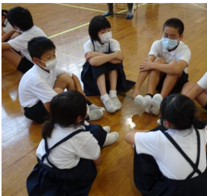
縦割りグループで、どうすれば良いのか話し合っています。