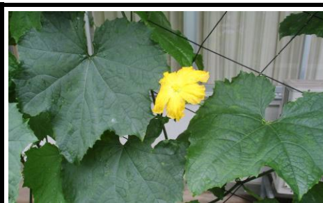
四年生のヘチマの花が咲いています。