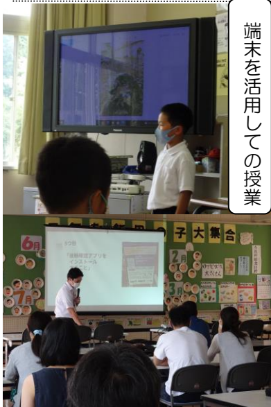
端末を活用しての授業

①GIGAスクール構想について②端末を用いて体験③家庭での約束の3つのことについて知っていただきました。学校や家庭での端末の活用により、ますます学習の在り方が変わってくることを実感できる場となりました。