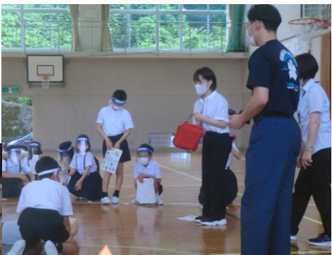
6年生もお家の人と一緒に参加しました。

学習参観の日(十日)に、珠洲消防署から三名の方に来ていただき、六年生と保護者の方を対象に、救命講習を行いました。コロナウイルス感染予防のことも含めた講習でした。救命と感染予防の二つの観点から教わることができました。積極的に講習会に参加していただきありがとうございました。