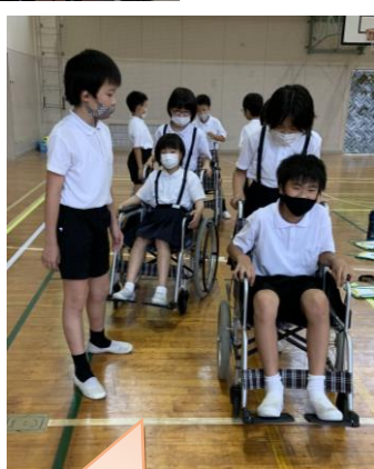
体験を通して、新たな気づきがありました。

※暑い日が続いています。ご家庭におかれましては、塩分や水分をこまめにとられ、熱中症に十分注意してください。