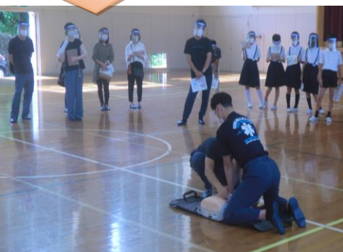
フェイスシールドをつけ、感染対策をしながらの講習となりました。ありがとうございました。