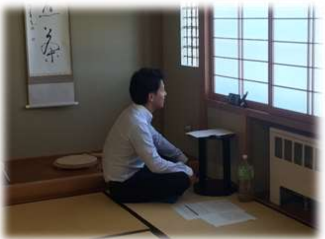
新入生とオンラインで個人面談