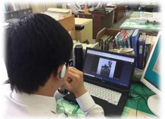
部活動のトレーニングも動画で報告（野球部）