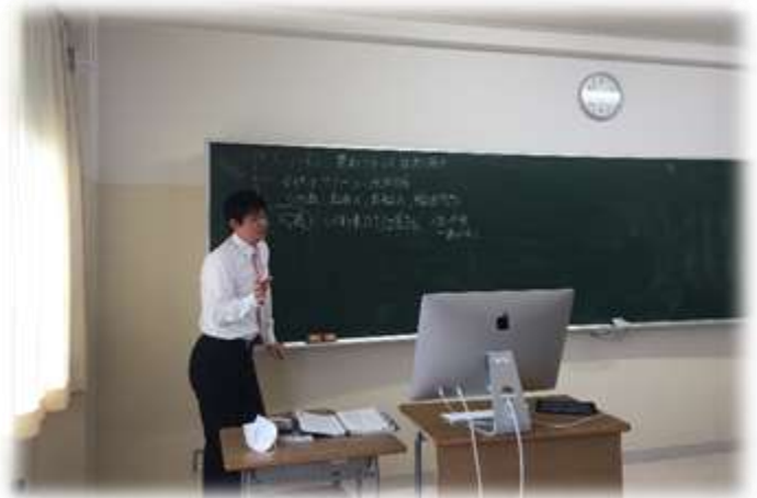
普通教室でもオンライン授業