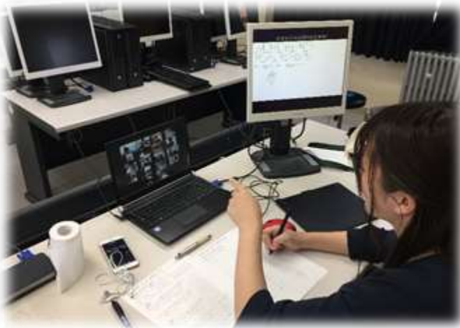
学校のPC室でオンライン授業