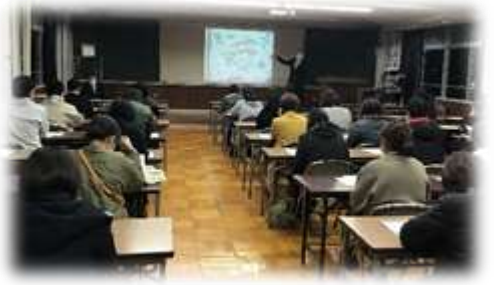
〈保護者説明会の様子〉

延期されていた第2学年の沖縄への修学旅行を令和4年2月20日(日)～23日(水)に実施の方向で検討しています。保護者説明会では、修学旅行の教育的な意義や実施する際の感染対策について説明をし、皆様からのご意見を伺いました。今後は、感染状況等を勘案しながら計画を進めて参ります。