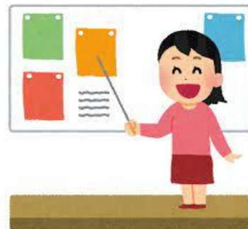
↑ 午前、計11の会場に分かれて発表を行いました