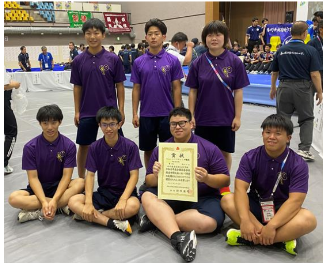
【下段】 全国高等学校総体百博大会ウエイトリフティング競技 【上段】 第70回 全国高等学校ウエイトリフティング競技選手権大会 【中段】 第25回 全国高等学校女子ウエイトリフティング競技選手権大会