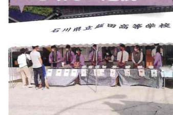
狼煙フェスティバル