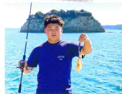
“釣りだけでなく釣った魚も満喫するには?”