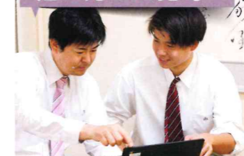
進路チューター制