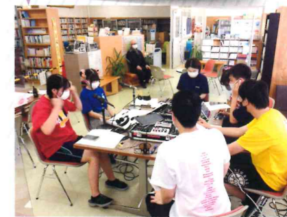
“地域住民が楽しめる高校生企画のラジオとは?”