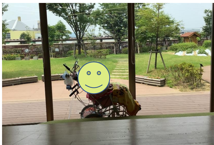
大きな窓からの風景が絵画のよう☆