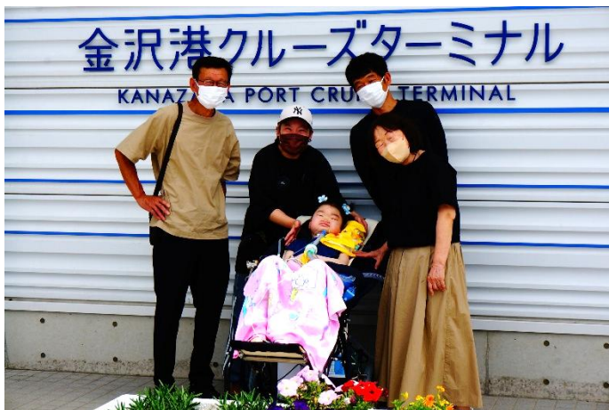
家族と合流して記念撮影☆

1回目の校外学習は金沢港クルーズターミナルに行ってきました。ジャンボタクシーでのお出かけです。入学後初めての遠出の児童生徒もあり、ドキドキワクワクでした。現地では海風を感じたり、家族とのひとときを過ごしたりすることができました。