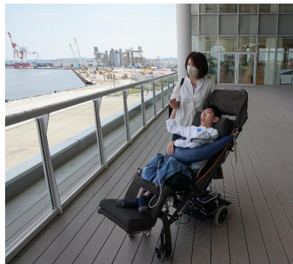
デッキで散策 『風が気持ちいいね』