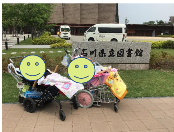
ここでも記念撮影しました

2回目の校外学習は石川県立図書館に行ってきました。参加者は高等部3年生のため学校行事では最後のお出かけです。やや蒸し暑さを感じる日ではありましたが、館内は過ごしやすく楽しく見学できました。本を見たり素晴らしい建物内を散策したり、貴重な時間を過ごしました。