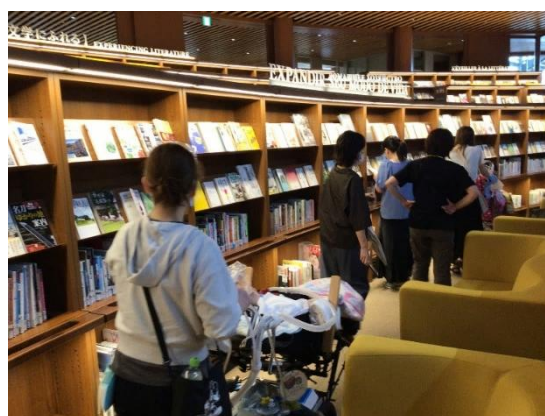
出会いの窓を散策中