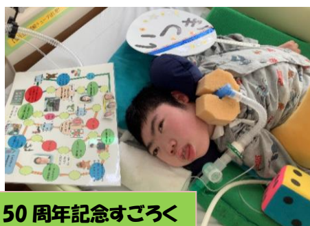
50周年記念すごろく