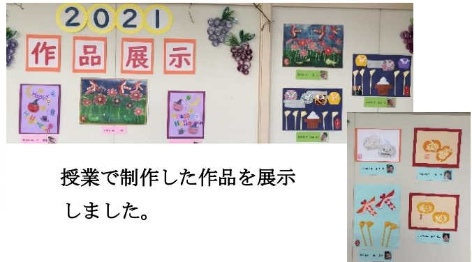
授業で制作した作品を展示しました。