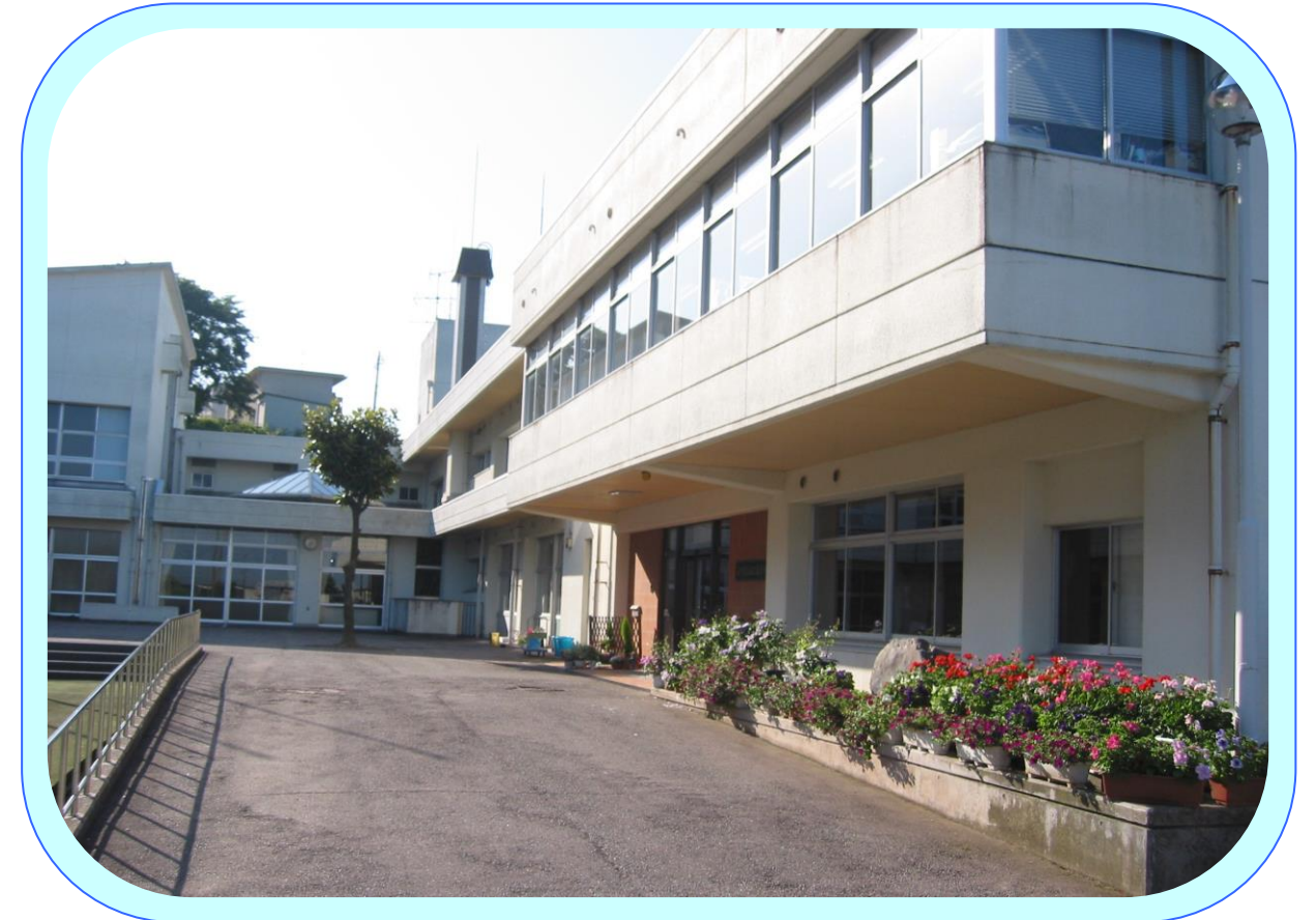
県内で唯一の病弱特別支援学校です