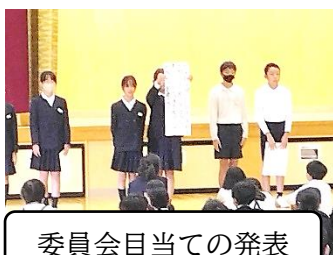
委員会目当ての発表