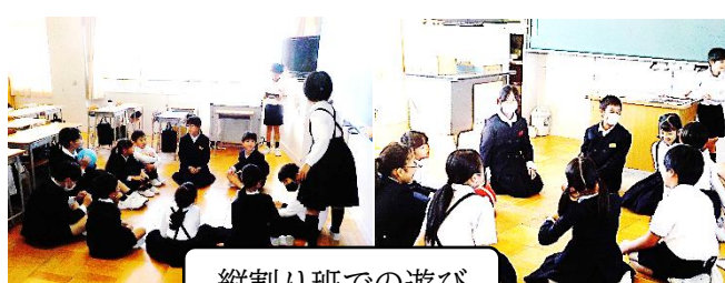
縦割り班での遊び