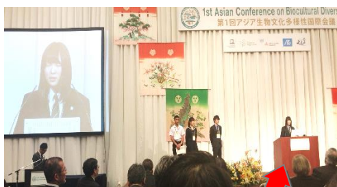
本会議での英語スピーチ