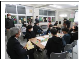
写真6 イントロクイズ