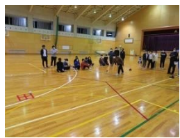
写真2 ポッチャ体験