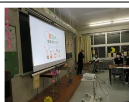
写真8 なぞトレクイズ