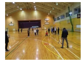
写真3 校内ポッチャ大会