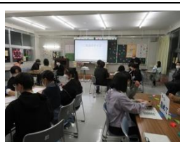
写真7 城北高校先生クイズ