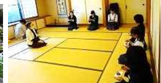
茶道クラブ地域の先生と