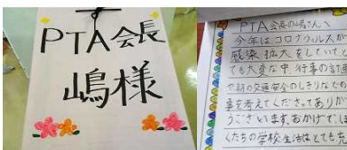
感謝の気持ちを込めて

児童会で地域の皆様へ感謝の気持ちを込めて、お手紙を書きお届けしました。たくさんの地域の皆様が子供たちの成長を願って応援してくださっていることに感謝する心を育てていきたいと思います。そして、地域の皆様の応援を子供たちの学びにつなげていきたいと思えます。今後ともどうぞよろしくお願ひいたします。