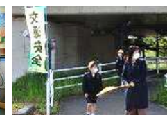
毎日の交通安全の見守り