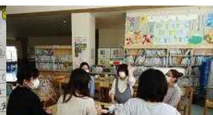
図書ボランティアさん