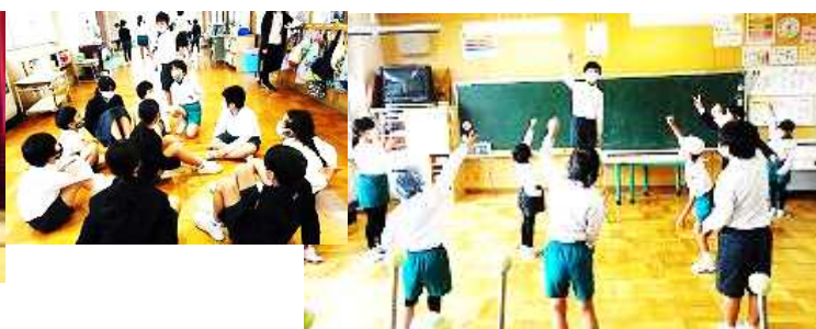
6年生のリードによる、なかよし班でのなかよし遊び