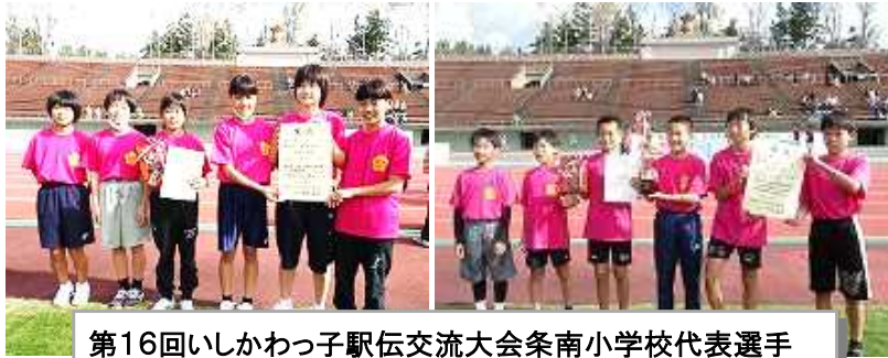
第16回いしかわっ子駅伝交流大会条南小学校代表選手

県内の小学校から今年は女子61校、男子58校がエントリーして出場を認められ、11月3日の文化の日に西部緑地公園陸上競技場で健脚を競い合いました。条南チームは男女ともに優勝争いに食い込み、力強い走りで、輝かしい栄光を手に入れました。この日にいたるまで、全校での走ろう運動が終わった後も、毎朝始業前から運動場で練習を積み重ねてきましたし、日頃からもスポーツに取り組み体力を向上させてきた努力のたまものであると思います。条南小チームは自己ベスト記録を出して走りぬぎ、体力と根性はみごとなものでした。区間賞を受賞した選手もいました。おめでとうございます。(詳しくは次号で紹介します)