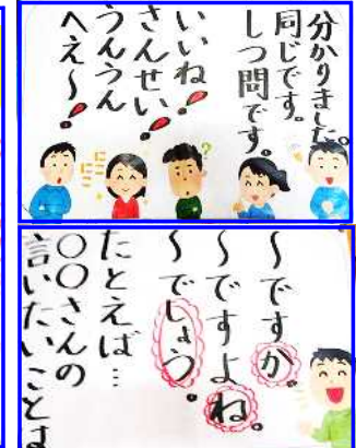
↑ ↓ 3年1組の掲示より