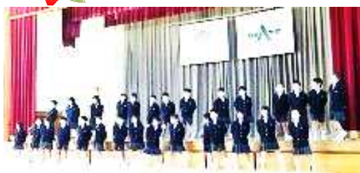
学級みんなの心を一つにしてがんばった 歌声集会 11月5日(金)