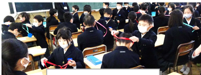
1年生からペンダントのプレゼント渡し