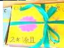
2年生からの招待状

6年生の気持ちを受け継いで「いじめを撲滅」し、先あいさつを自分からできるようにがんばります。