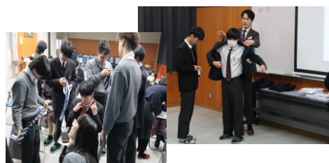
ネクタイの締め方（左） スーツの着こなし方（右）

身だしなみについての話を聞いた後、TPOを意識しその場に合った着方をすることを教わりました。そして全員でネクタイの締め方を実践し、最後にスーツを着るうえで気を付けるポイントを学びました。これからの社会人生活に生かしていきたいです。