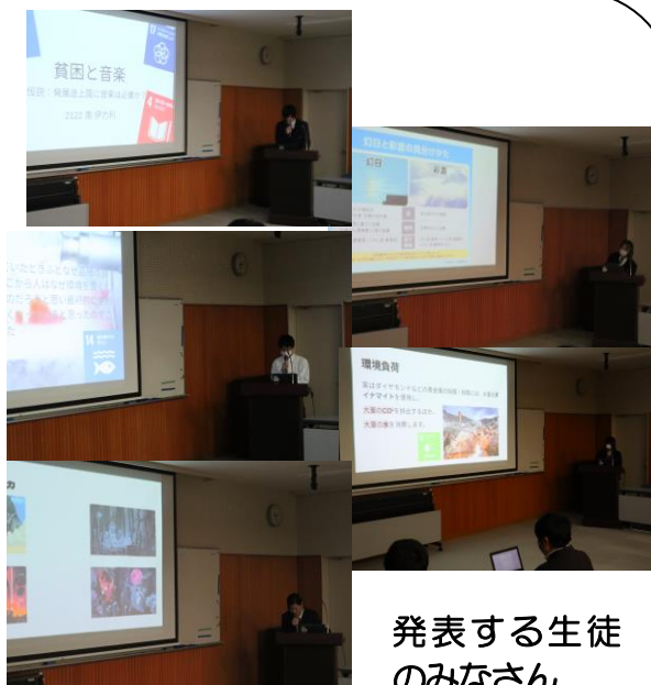
発表する生徒 のみなさん