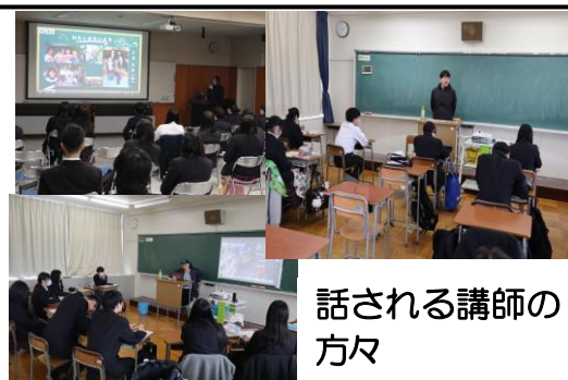
話される講師の方々