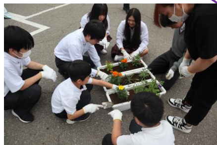
プランター花植えの様子

5月22日（木）「第二回KCB活動（プランター花植え）」を行いました。本校生徒だけでなく、動橋小学校の児童や本校保護者の方々にも参加していただき、参加者は100名以上になりました。