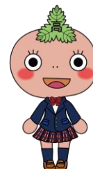
加賀高校マスコット 「かがんちゃん」

6月9日（月）本校にて法政大学、加賀高等学校、加賀市の包括連携協定式が執り行われました。法政大学は、東京の有名私立大学「MARCH」の一角を担い、東京6大学の一つでもあります。今後は、加賀市の協力のもと、本校の授業、部活、探求活動など様々な分野で協力していきます。今後の動きにぜひご注目ください！