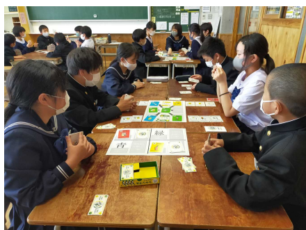
防災カードゲーム「シャッフル」

地域・関係機関と連携を取りながら、防災・減災に対する知識と実践的スキルを身につけていこうと考えています。ご家庭においても、是非話題にしてみてください。（裏面に資料あり）