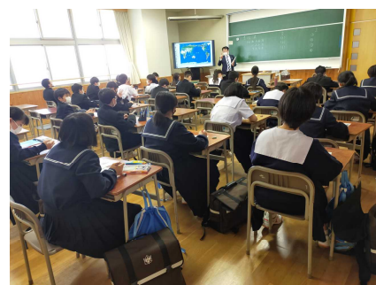
↑ 社会科の補充教室