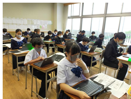
内閣府の「震災シミュレーション」