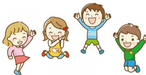
子ども達と同じ目線でふれあったり、優しく見守る様子