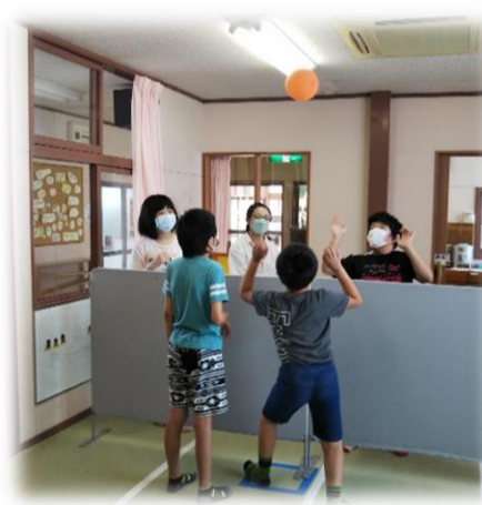
子ども達と風船ゲームを楽しむ様子