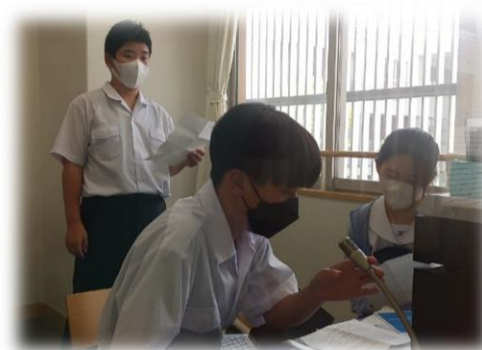
お昼の校内放送でスライドによる周知活動の様子