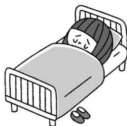
たいちよう わる 体調が悪いとき