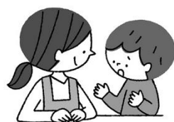
そうだん 相談があるとき