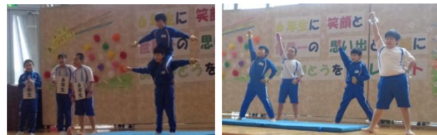
4年生『金津っ子ステーション』