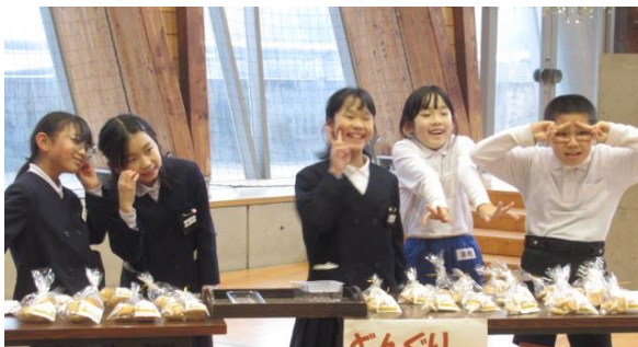
3・4 年総合「金津の森改善プロジェクト」