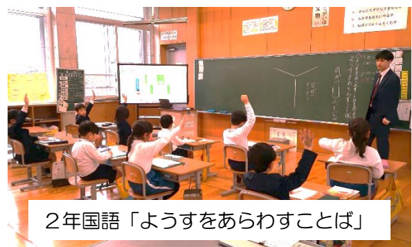
2 年国語「ようすをあらわすことば」