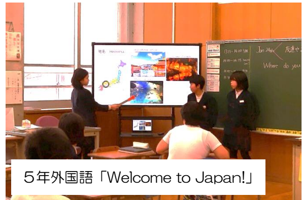
5 年外国語「Welcome to Japan!」