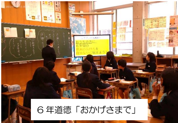
6 年道徳「おかげさまで」