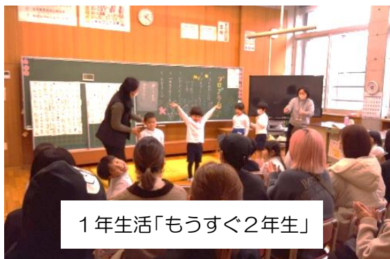
1 年生活「もうすぐ2年生」