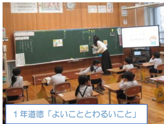
1年道徳「よいこととわるいこと」