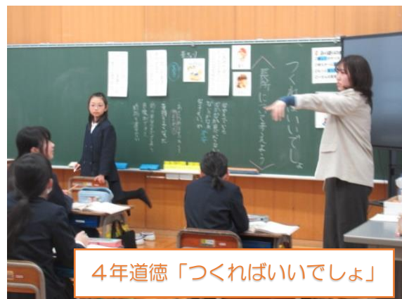
4年道徳「つくればいいでしょ」