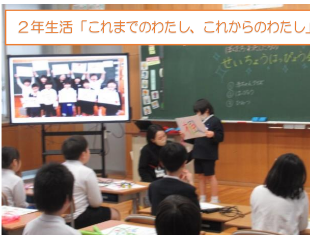
2年生活「これまでのわたし、これからのわたし」