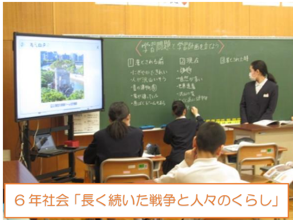
6年社会「長く続いた戦争と人々の暮らし」