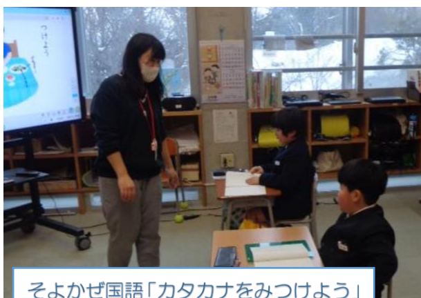
そよかぜ国語「カタカナをみつけよう」