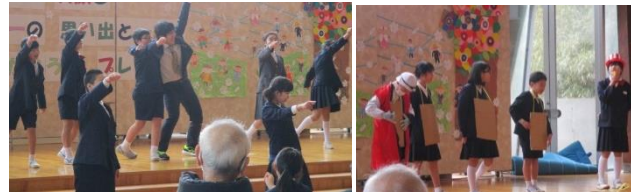
6年生『合唱～下級生への感謝をこめて～』