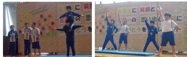
4年生『金津っ子ステーション』