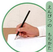
えんぴつのもちかた