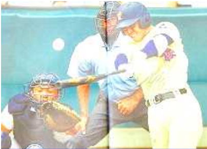
「決勝戦での星稜ナインの攻撃」

さて、いよいよ2学期がスタートしました。2学期は、笠野っ子のよさがますます発揮できますように、小規模校だからこそ、お互いのよさを喜び合い、みんなで目標達成に向かって進んでいきたいと思えます。