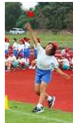
ジャベリックボール投げ