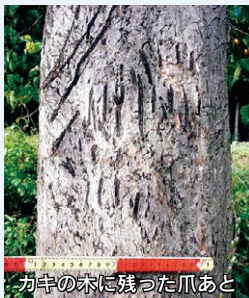
カキの木に残った爪あと