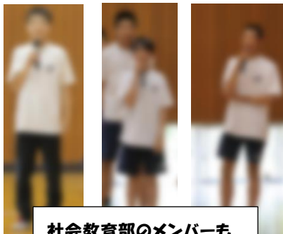
社会教育部のメンバーも、決意を語りました。