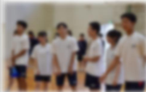
【青団結団式の様子】