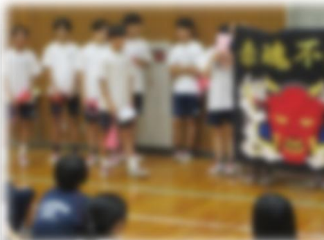
【赤団結団式の様子】