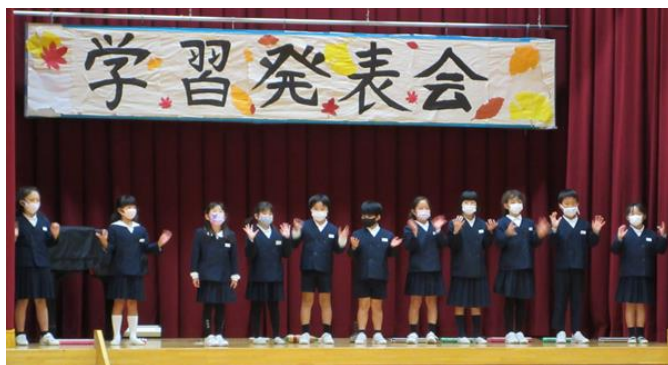
2・3年 あ きがつけば・・・ 耳をすませば聞こえる音を表現しました