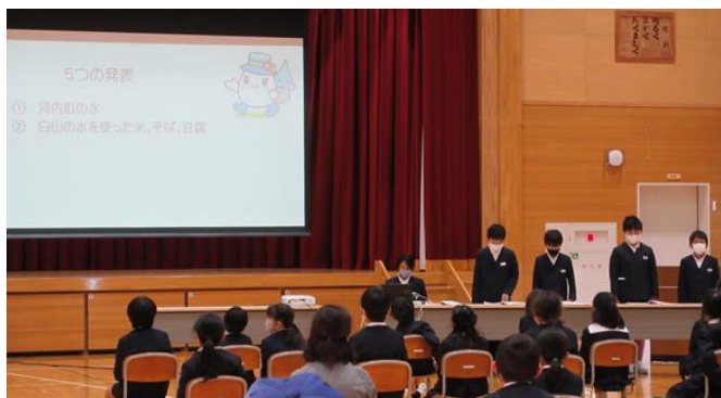
6年 河内町大好き 10月のジオパーク全国大会で発表した内容を全校に広めました