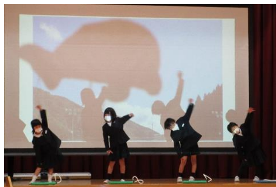
1年 くじらぐも くじらとの対話がんばりました