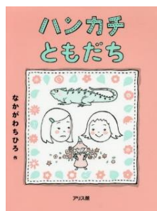
「ハンカチともだち」 なががわちひろ 作