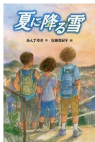
「夏に降る雪」 あんずゆき 作