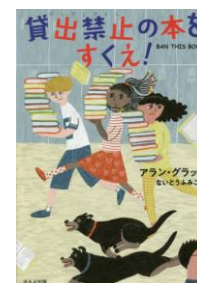
「貸出禁止の本をすくえ!」 アラン・クラッツ作