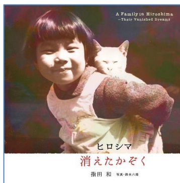
ヒロシマ 消えたかぞく