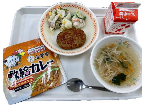
レトルトのカレー(ごはん入り)です

18日(火)に、地震と津波・浸水を想定した避難訓練を実施しました。はじめに、机の下でいすの脚をもって地震に対する避難行動をとった後、大津波警報が発令されたという設定で本校3階に移動しました。児童は訓練の大切さを理解し、静かに素早く行動できていました。また、その日の給食は防災に関する給食ということで、白米のかわりにレトルトパックに入ったカレーライスを食べました。概ね好評だったようです。昨今、地震や大雨による浸水など全国各地で多くの災害が見られます。本校でもいざというときのために、災害に対する備えをしてきたいと考えております。