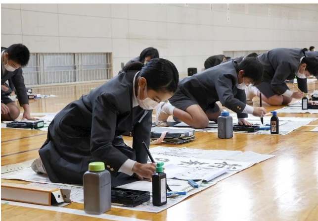
気持ちを引きしめて一画一画ていねいに