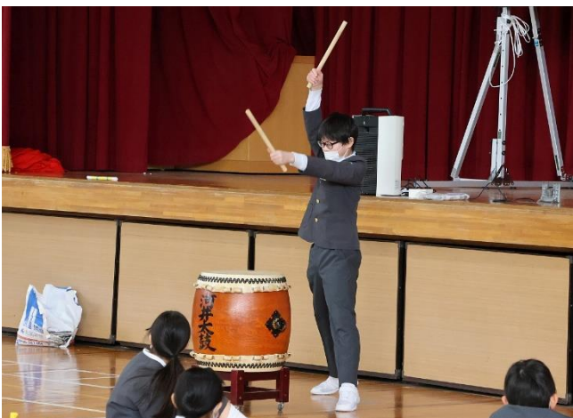
勇ましく打ち鳴らす太鼓とともにスタート

1月10日（火）に書き初め大会が行われました。体育館では中・高学年が6年生の勇ましい太鼓とともに書き初めを開始。字の上達を祈願しながら一画一画ていねいに筆を運びました。低学年は各教室で鉛筆を使った硬筆に挑戦。中・高学年同様に真剣なまなざしで紙面に向かっていました。