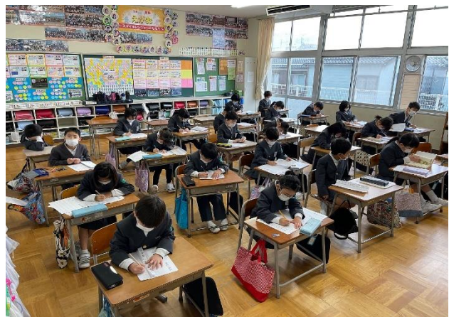
低学年は教室で硬筆に取り組みました