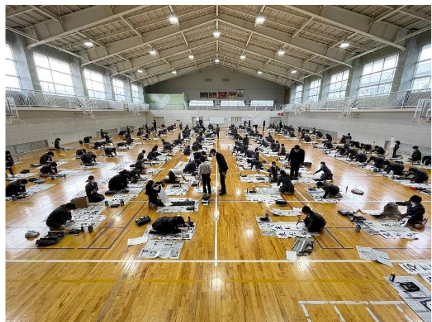
体育館をいっぱいを使って毛筆