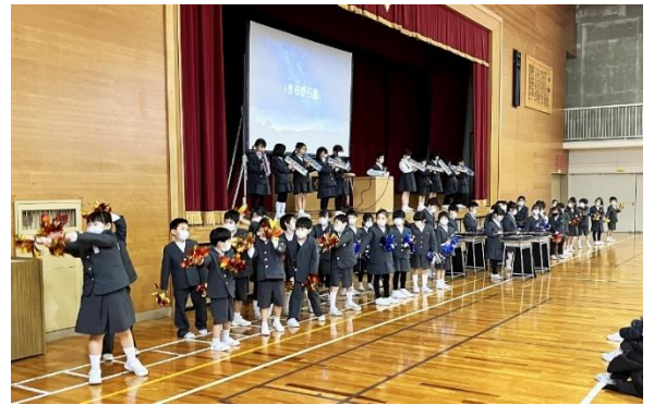
練習の成果をじょうぶんに発揮できました

ステージに上がる前には、少し緊張している様子が見えましたが、発表のときには大きな声で堂々と話すことができました。1年生とは思えないすばらしい発表になりました。